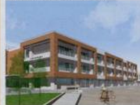
勝間小完成パース