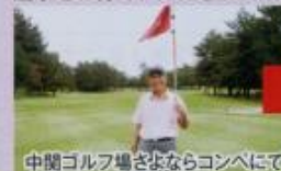
中間ゴルフ場よりコンペにて