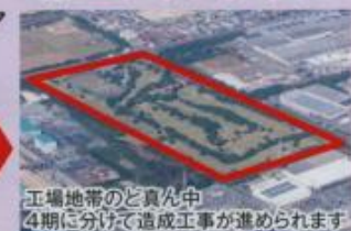
工場地帯のど真ん中 4期に分けて造成工事が進められます