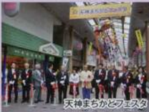
天神まちかどフェスタ