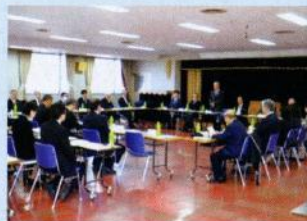
11月22日 ホストタウン推進事業実行委員会

2020年東京オリンピック・パラリンピックの開催に向け、参加国との交流を行い、 地域の活性化等に資することを目的とした国の制度です。