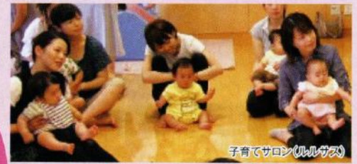
子育てサロン(ルルガス)