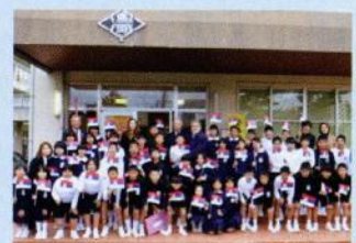
11月10日 駐日セルビア大使、勝間小学校訪問