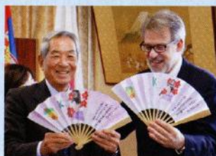
11月9日 駐日セルビア大使ご来防

官民一体となった実行委員会を中心に して、男女バレーボールチームの事前 合宿誘致だけでなく、様々な交流事業 を行います。 ※セルビア女子バレーボールチーム は、リオ五輪で銀メダル獲得の強豪 チームです。