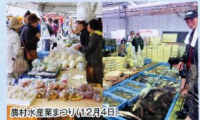
全道うまいぜの市