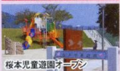
桜本児童遊園オープン