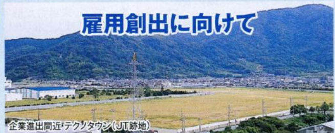
企業進出間近・テクノタウン(JT跡地)