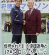
優勝された川内優輝選手と12月21日 ソニーアリーナ