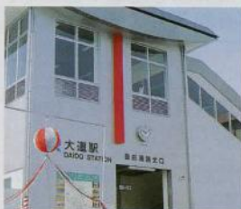
自由通路で南・北が繋がりました