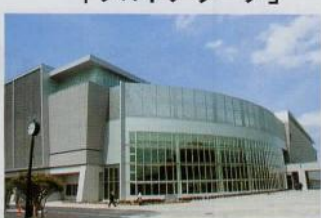
若い人からご年配の方々まで大好評です