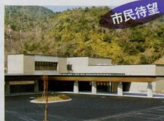
お通夜からご葬儀まで