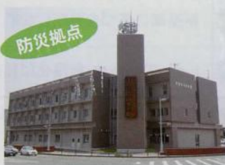
電光掲示板が好評です